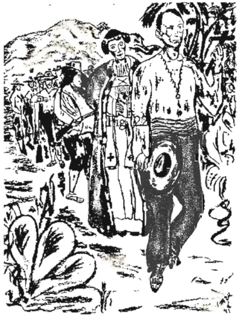
CAMINO AL PATÍBULO "LLEVA EL SOMBRERO EN LA MANO DERECHA Y EN LA IZQUIERDA EL CRUCIFIJO..." (p.245)