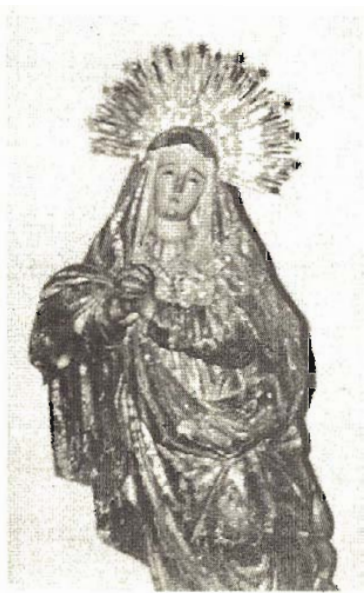
ESTATUITA DE LA DOLOROSA QUE WALKER VENERÓ EN SU CELDA DURANTE ESTOS ÚLTIMOS TRANCES DE SU VIDA (p.243).

"LUEGO QUE WALKER ENTRÓ A LA PRISIÓN, SE LE ADAPTARON GRILLOS BIEN FUERTES..." (P.243).