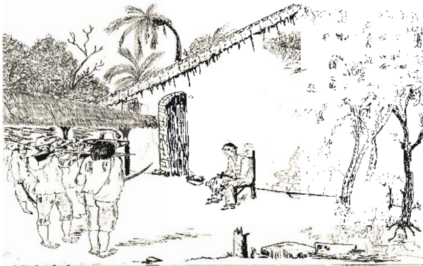
"SE SIENTA EN LA SILLA DEL CADALSO, PARECIDA A LA QUE ÉL DISPUSO PARA EL FUSILAMIENTO DEL GENERAL CORRAL, LEGITIMISTA, Y DEL GENERAL SALAZAR, DEMÓCRATA, ANTE DOLIDOS OJOS NICARAGÜENSES EN LA PLAZA DE GRANADA" (p.246).