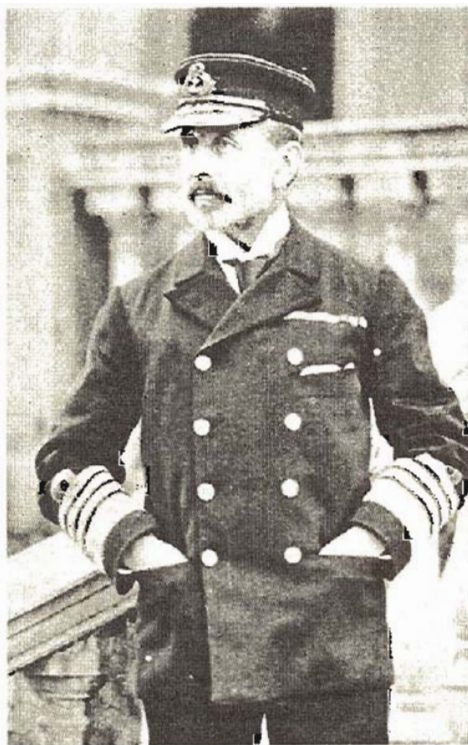
CAPITÁN NORVELL SALMON

"SALMON LE ENVÍA EL 21 DE AGOSTO UNA NOTA PERENTORIA A WALKER..." (p.236)