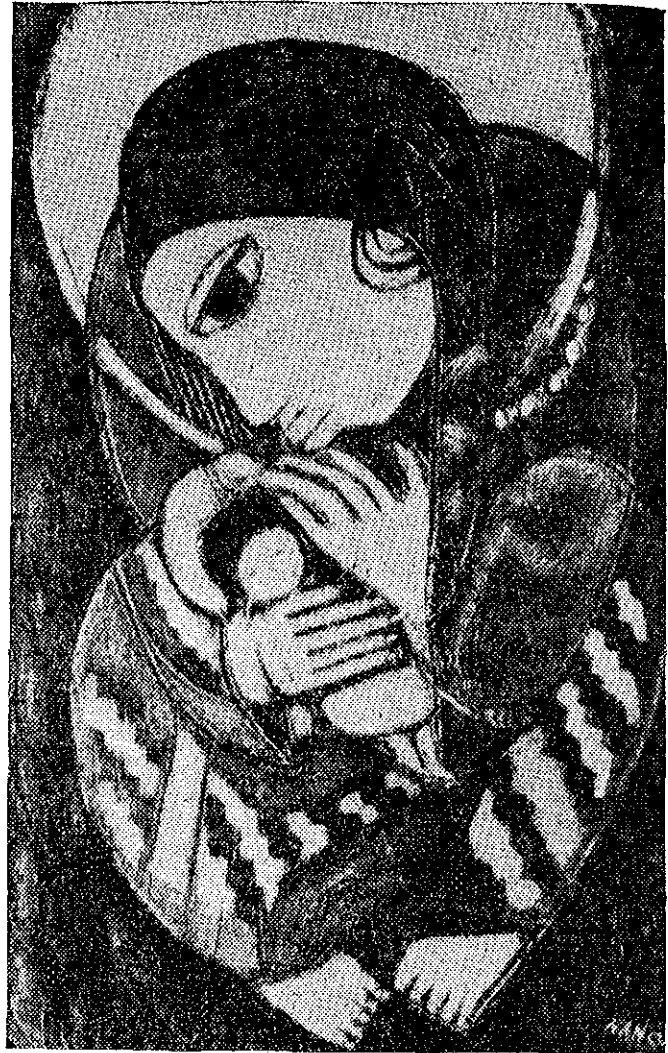
"La virgen india de Guatemala" de Nan Cuz, preciosa creación artística que ha merecido el elogio de la crítica europea y cuya reproducción ofrecemos a nuestros lectores.

REVISTA CONSERVADORA DEL PENSAMIENTO CENTROAMERICANO se complace en presentar a sus lectores estas notas que reflejan el ansia de expresión de Centro América en los campos del arte.