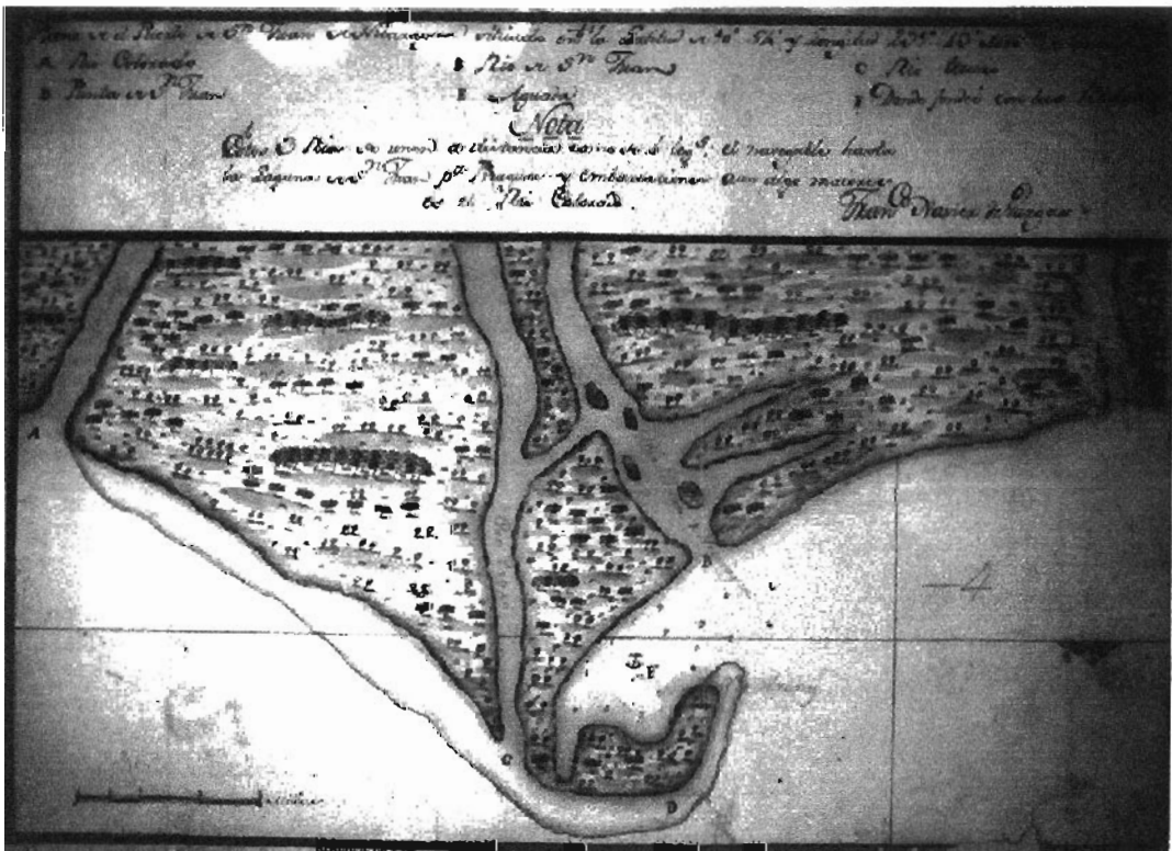
Mapa de las bocas del Río de San Juan de Nicaragua por Francisco Xavier de Vargas en 1777