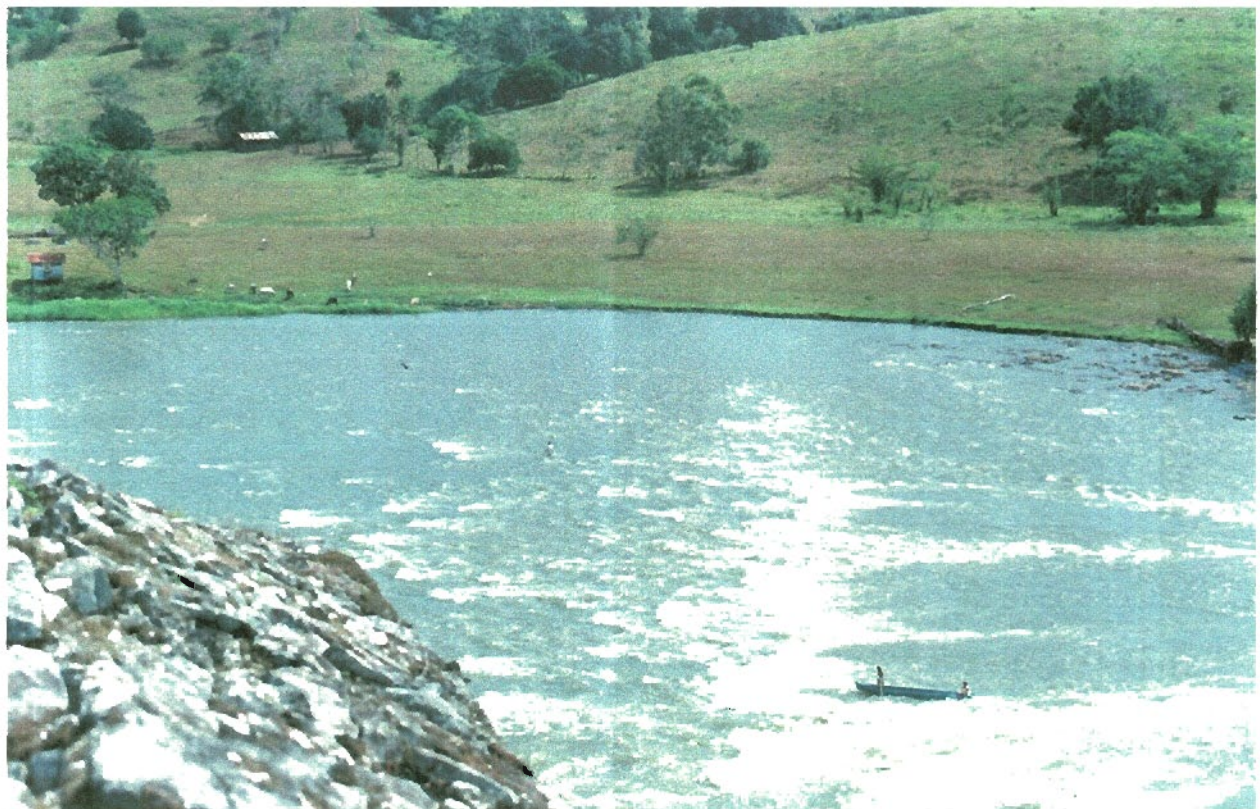
Raudal del Castillo, Río de San Juan de Nicaragua