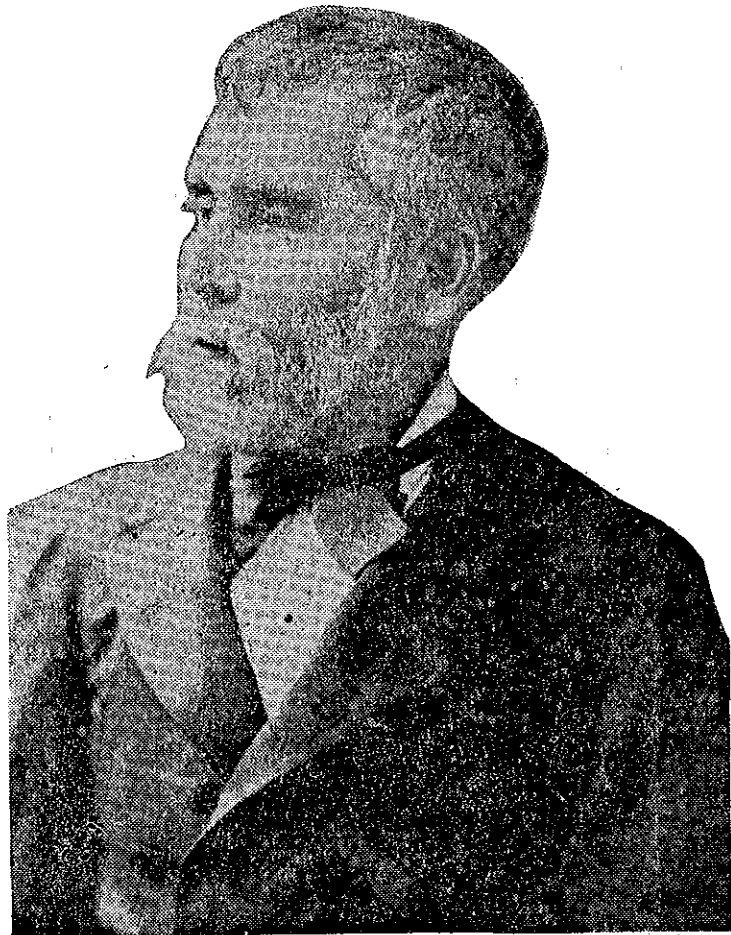
El General Joaquín Zavala, nuestro David