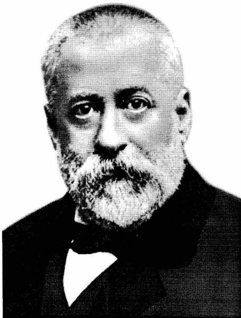
Marcelino Menéndez y Pelayo