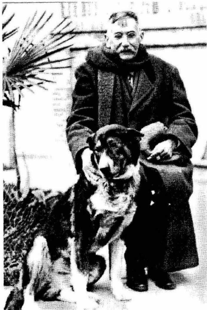
Benito Pérez Galdós