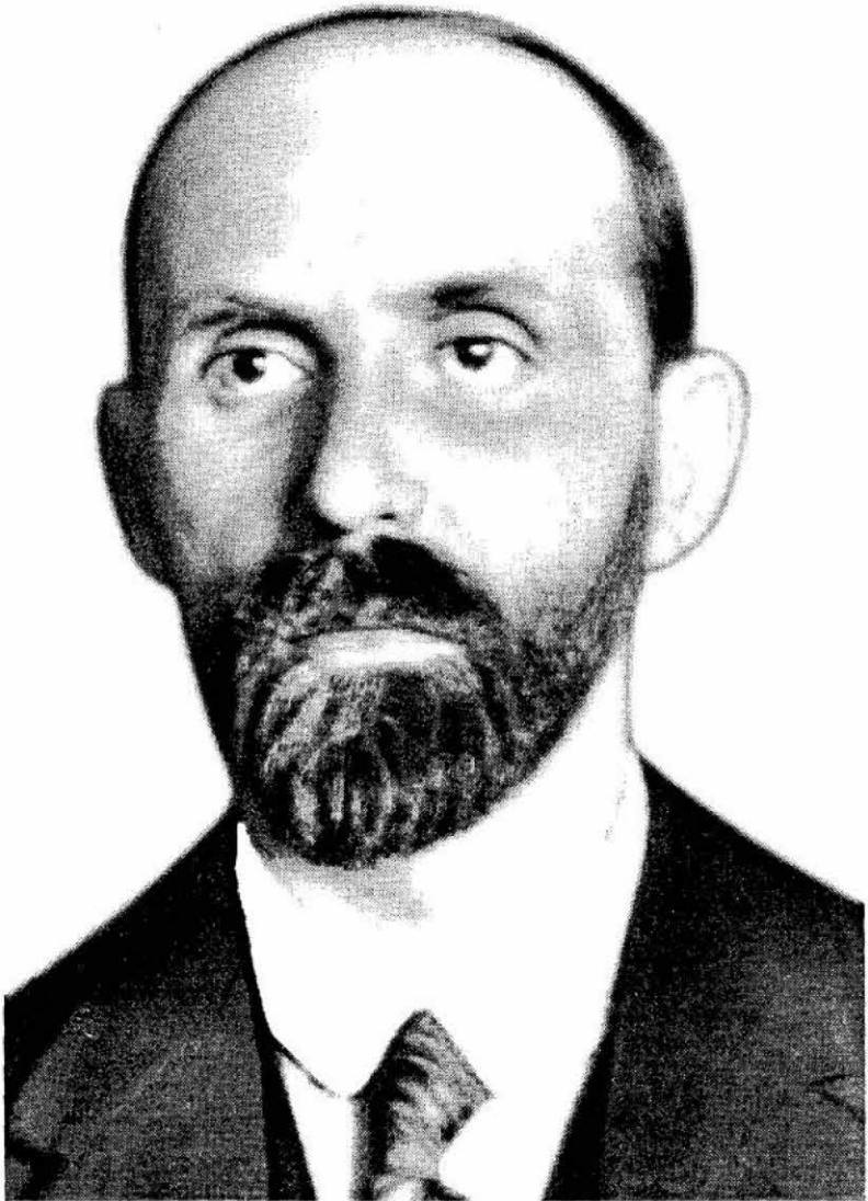
Juan Ramón Jiménez