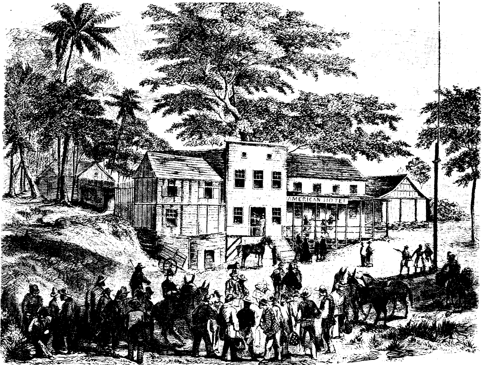
Half-way House on the road to San Juan.