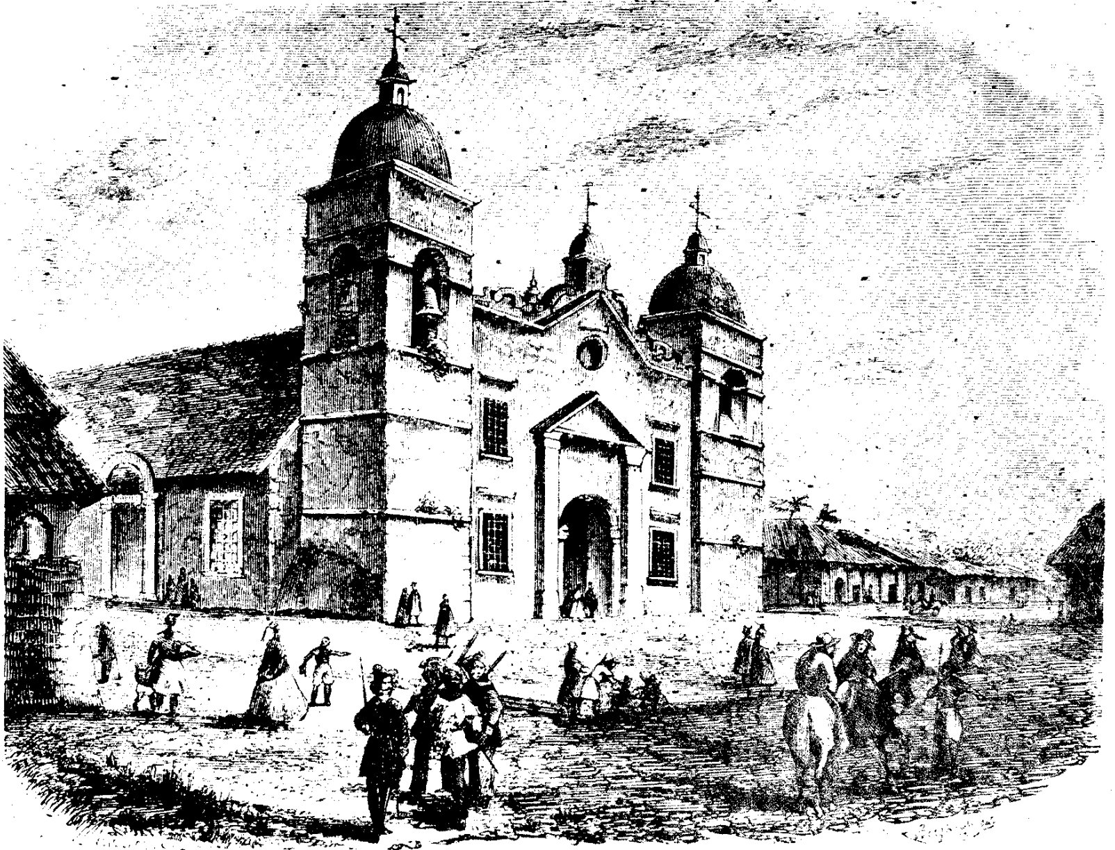
Grand Cathedral, on the main plaza, city of Grenada, Nicaragua. 1