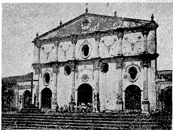
La iglesia de San Francisco, erigida por el fundador de Granada, Francisco Hernández de Córdoba, es el primer templo fundado por los españoles, en estas tierras de América.