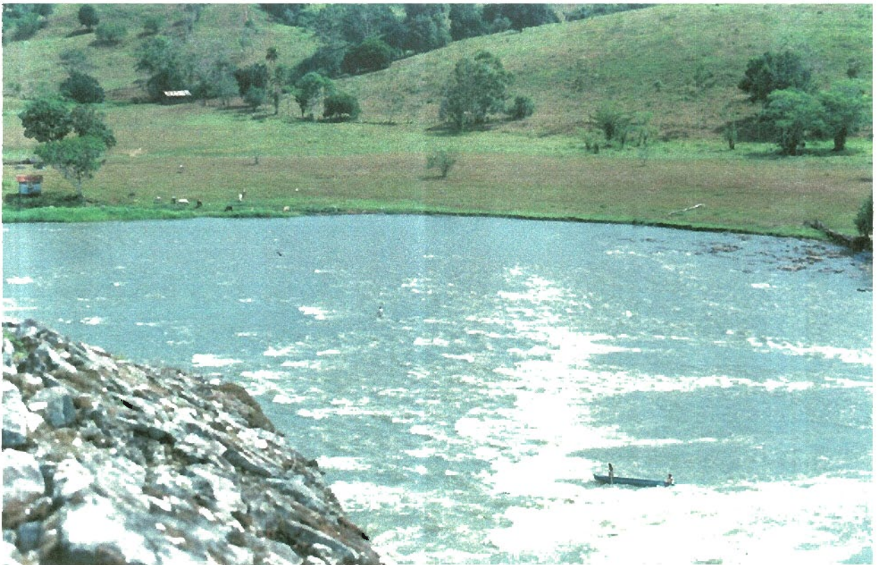
Raudal del Castillo, Río de San Juan de Nicaragua