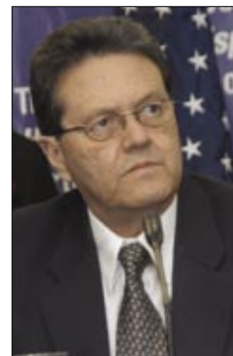
Norman García Ministro de Honduras

“Estamos complacidos con los resultados de la negociación, ya que se ha percibido como un acuerdo más allá del comercio. Vamos hacia la modernización de nuestros gobiernos, hacia la transparencia. Estamos satisfechos que CAFTA reconozca los niveles de desarrollo distintos entre nuestros países y adecue a nuestras realidades. La Cooperación permitirá fortalecer las capacidades de nuestras empresas”.