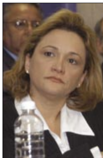
Patricia Ramírez Ministra de Guatemala

“Hoy estamos marcando historia, dejando atrás una larga historia de inestabilidad regional. Estamos juntos, dispuestos a enfrentar riesgos, comprometidos a trabajar en nuestros países porque se ratifique este Acuerdo. Estados Unidos ha demostrado ser un buen socio. Necesitamos nuevos mercados para nuestros productos y trabajar también en favor de los consumidores”.