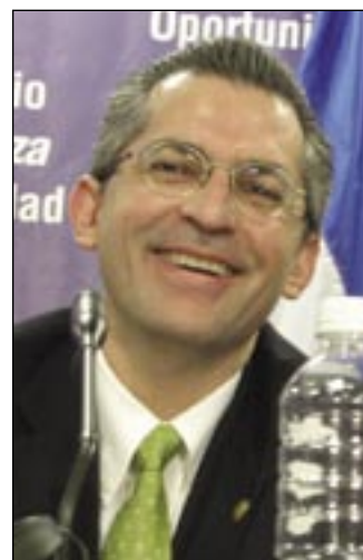
Miguel Lacayo Ministro Economía El Salvador

“Hoy es un día muy importante para Guatemala, estamos entrando a una nueva era de comercio, de paz y de desarrollo. Sabemos que no es la panacea, pero representa uno de los pilares sobre los cuales se puede construir mi país. Hay que seguir trabajando por mejorar el clima de inversiones, por aplicar las leyes laborales y trabajar por el progreso. Llevamos años trabajando por la integración regional y hoy estamos más unidos”.