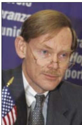
Robert Zoellick Representante Comercial de los Estados Unidos

Ahí, en ese escenario histórico, la delegación nicaragüense celebró junto a sus homólogos de Estados Unidos, Guatemala, El Salvador y Honduras, el inicio de una nueva era de prosperidad, progreso y empleo, como resultado de una mayor apertura comercial, del potencial productivo e inversionista, y de más altos niveles de exportación.