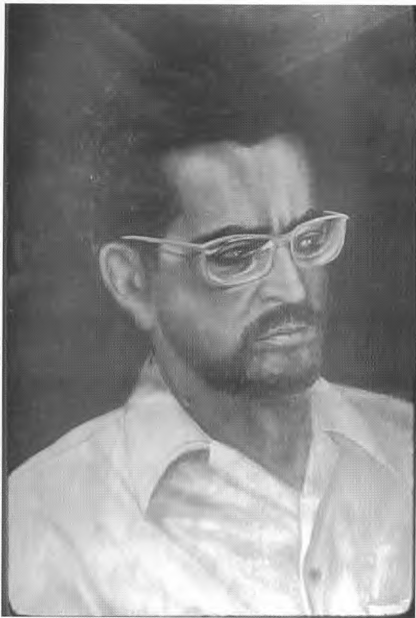
Carlos Fonseca Amador