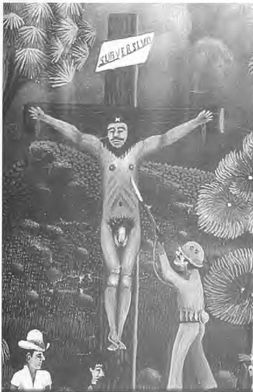
Anticristo al desnudo