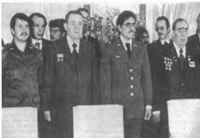
Henry Ruiz, Andrei Gromyko, Daniel Ortega y Leonid Brezhnev Recepción en el Kremlin