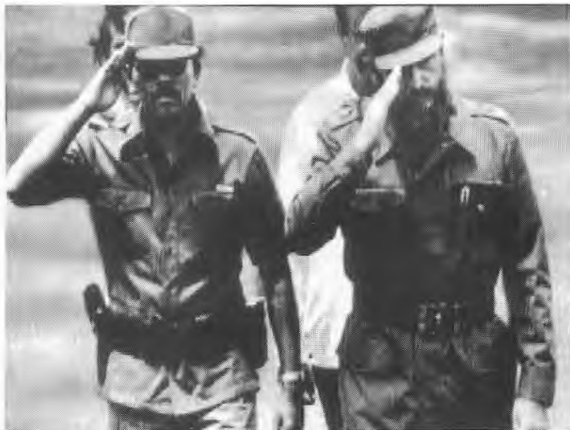
Daniel Ortega y Fidel Castro Revista de tropas en Managua