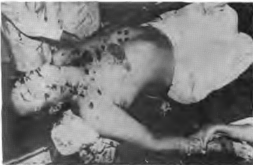
¡Mandaron a asesinarlo! La Prensa , 10 enero 1978

TODAVÍA SE DESCONOCE el nombre de la persona que ordenó asesinar a Pedro Joaquín Chamorro el 10 de enero de 1978, a pesar de que los supuestos asesinos materiales caen en manos de la justicia de inmediato. Los hechos conocidos señalan que el asesino intelectual es miembro del FSLN, como puede verse en el Anexo D: ASESINATO DE UNA NACIÓN. La intensa campaña que desata La Prensa , culpando a Somoza del crimen, genera apoyo popular a la insurrección que encabeza el FSLN, incendia a Nicaragua, y acelera y asegura la caída del dictador. En marzo de 1979, Fidel Castro reúne en La Habana a los líderes de las tres facciones del FSLN, coge tres de cada una, y forma la Dirección Nacional de nueve “comandantes” con los que se apodera de Nicaragua al caer Somoza el 19 de julio de 1979.