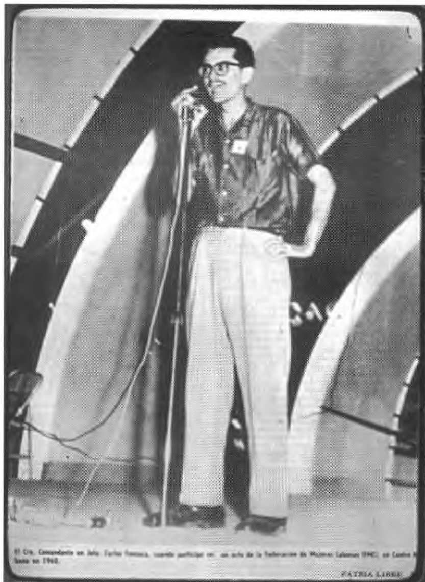
El Cdr. Comandante en Jefe Carlos Fonseca, cuando participó en un acto de la Federación de Mujeres Cubanas (FMC), en Castro M. de Sosa en 1960.