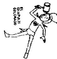
EL CHAVO DEL CHAVO