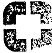
No. 116 R.P.I.